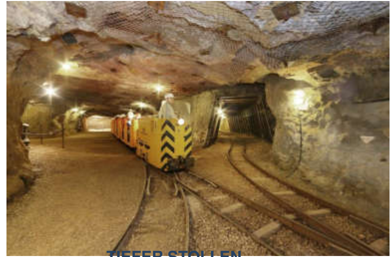
TIEFER STOLLEN, AALEN