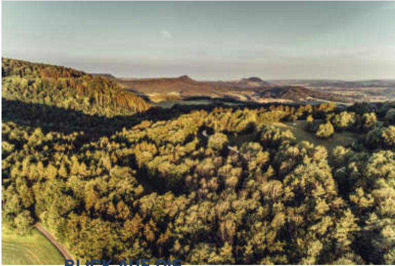
BLICK AUF DIE DREIKAISERBERGE