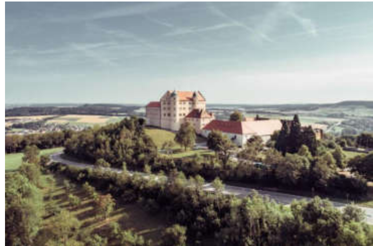
SCHLOSS KAPFENBURG, LAUCHHEIM